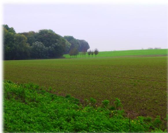
Abb. 1 Feldblick

(Wer längere Umstiegszeiten benötigt, fährt besser die frühere U2)