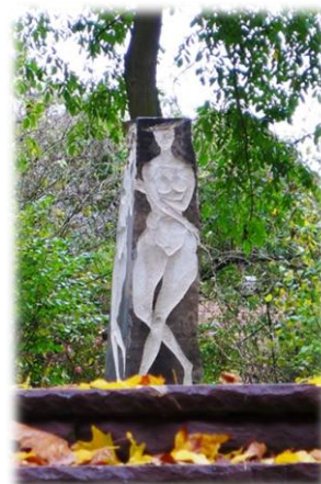
Abb. 3 Auenkunst