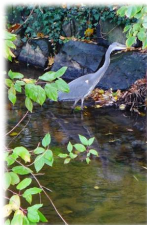
Abb. 2 Reiher im Erlenbach