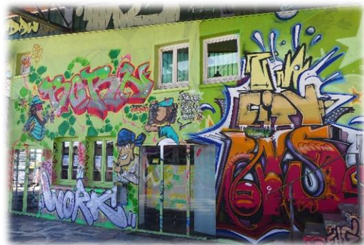
Abb. 3 Jugendhaus am Bügel