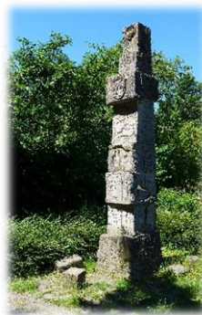
Abb. 2 Obelisk