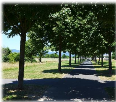
Abb. 1 Weingärtenanlage