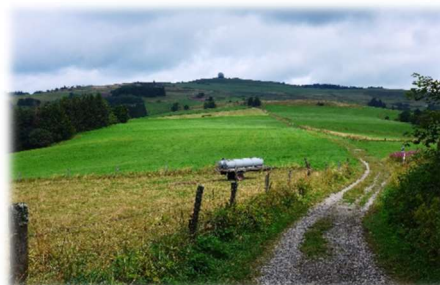
Radon auf der Wasserkuppe