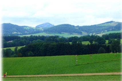
Blick zur Milseburg